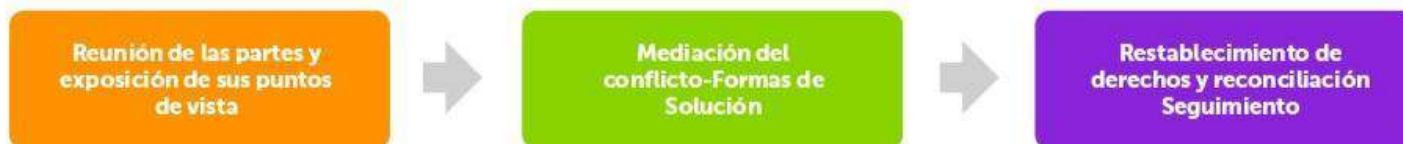
Figura 2. Protocolo de atención para situaciones tipo I